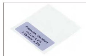
标准片(标配), 用于核对精度