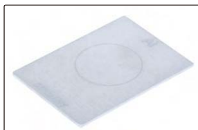
非铁基对零块(标配)